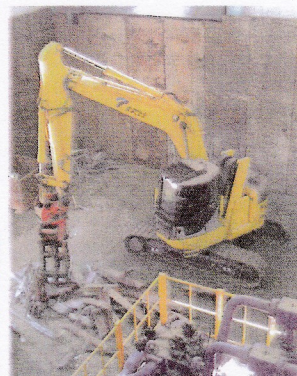
第二工場で稼働中のコマツ製PC228US

環境への配慮も 同社は今年の5月23日にISO14001の認証を取得している。第二工場に関する最高水準の防音パネルで周囲を囲うなど、環境への配慮も余念がない。 今後は、本社工場と第二工場をつなげてひとつの工場にし、タライ粉や新断など、これまであまり取り扱って来なかった品種の取り扱いも計画中だ。基本的に小口のお客様が多いこの会社にとって、これからも様々な細かいサービスを提供出来る強みを活かし、「他の問屋さんには真似の出来ない」業務を大切にしていきたいと考えた。