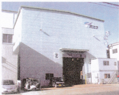
11月に稼働を開始したタニヒラの第二工場